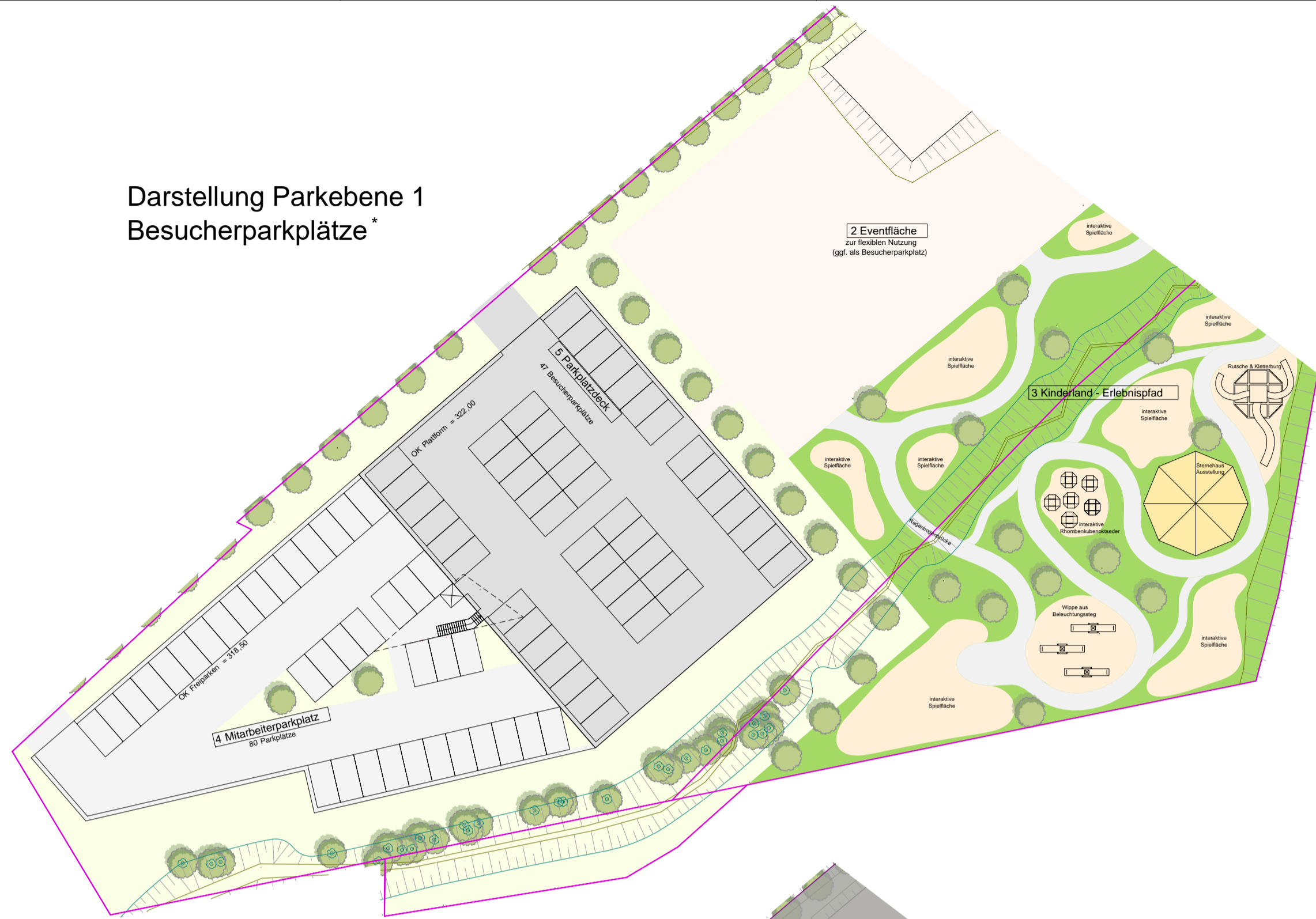
Darstellung Parkebene 1 Besucherparkplätze*