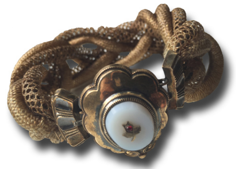
Armreif aus Haar | Mitte 19. Jh. Museum für Sächsische Volkskunst Dresden | Inv. B1657

Die Haarkunst-Ausstellung ist noch bis zum 23.10.2016 zu sehen.